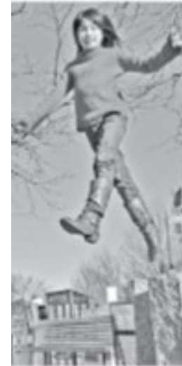
Рис. 1 высота – 12 см ширина – 10 см

Алина очень любит фотографироваться. Её подруга Лена сделала оригинальную фотографию Алины и напечатала небольшой образец размером 10 x 12 см. (Рис. 1).