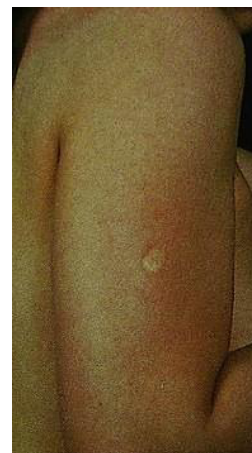
Следы прививки против оспы

В настоящее время в мире есть лаборатории, где хранятся вирусы оспы. В разных странах имеются разработанные модификации живых оспенных вакцин.