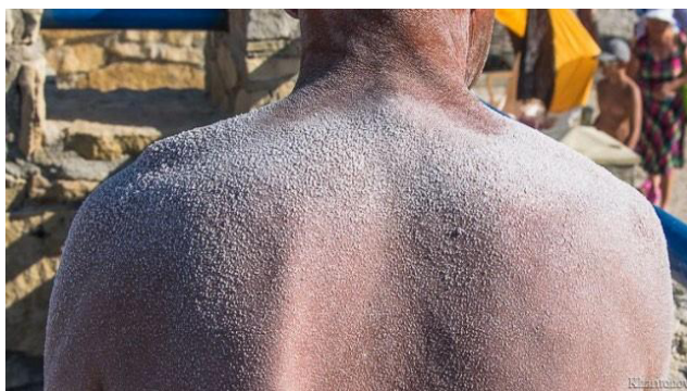
Рисунок 1. Отложение соли в оз. Баскунчак. Здесь добывается 80 % всей российской соли.