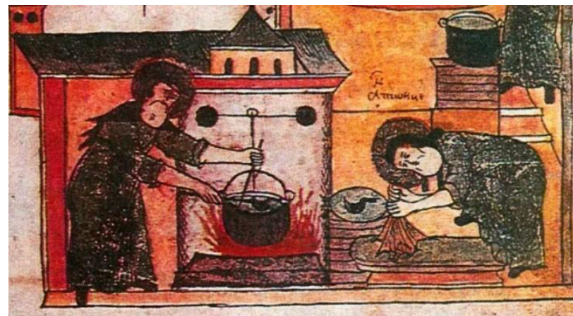
Рисунок 3. Получение соли вывариванием в Древней Руси.

На Руси, начиная еще с X века, получали соль путём выпаривания в больших чанах воды из солёных озёр или Белого моря. Но соль получалась «грязной» – содержала примеси посторонних веществ. Такая соль могла принести вред здоровью. Со временем её научились очищать, отделять от примесей.