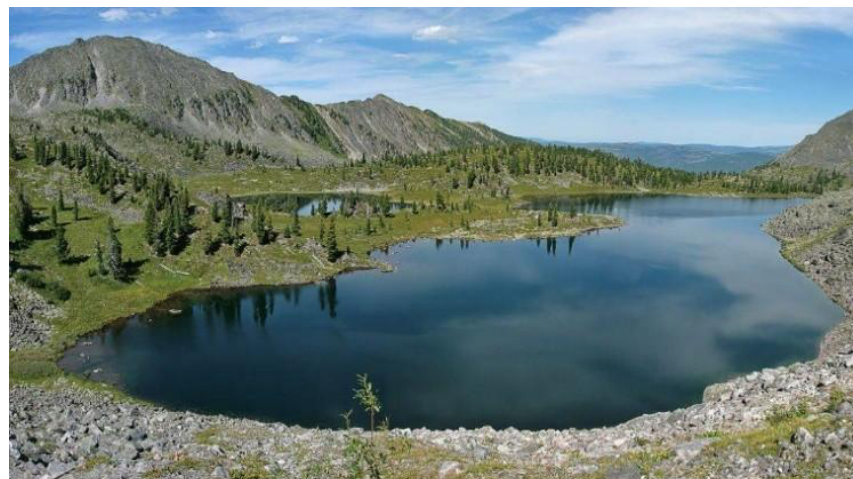
Рисунок 2. Соляное озеро Ши́ра (Хакасия).

В районе соляного озера Ши́ра существует легенда, по которой охотник случайно ранил на охоте вблизи озера свою собаку. Он оставил её местному жителю, так как был уверен, что она не выживет. Но собака, купаясь в озере, залечила все раны, и через некоторое время прибежала домой совершенно здоровой.