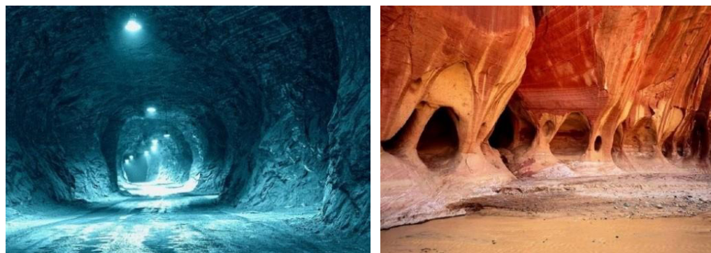
Рисунок 4. Подземные соляные пещеры.

Поэтому в соляных залах можно десятилетиями хранить запасы продуктов, и они не будут портиться. Хранят в таких подземельях и киноленты старых фильмов, древние книги, ценные меха и многое другое. Соль оберегает доверенные ей ценности от разрушения и порчи.